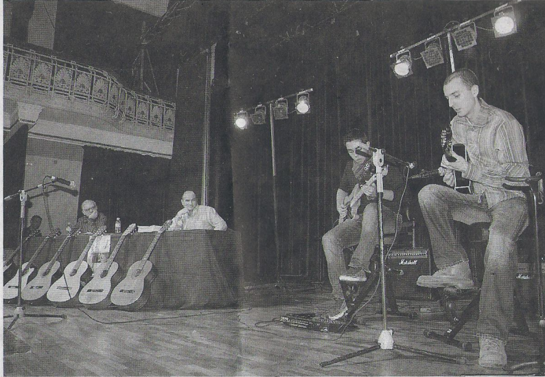
ÉXITO EN LA PRESENTACIÓN. El primer Congreso sirvió como presentación de la Asociación.

«El congreso pretende ser un punto de encuentro entre profesionales y aficionados a las diferentes modalidades de la guitarra, independientemente de su edad. Objetivo: intercambiar ideas y opiniones con el público asistente». Esta es la filosofía de la cita de esta